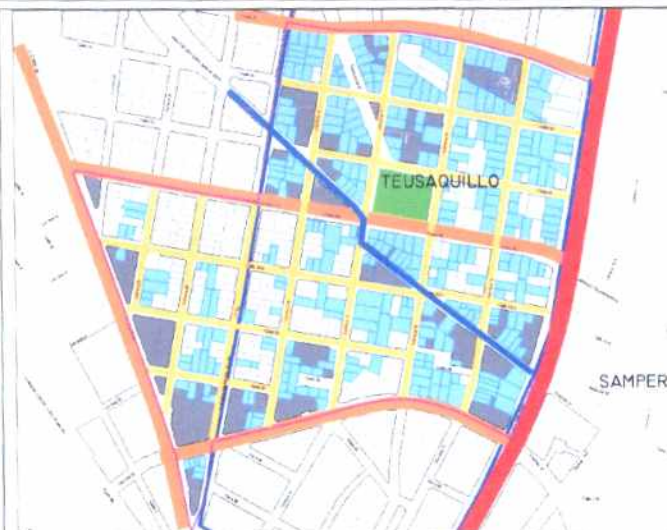
Inmuebles de Interés Cultural - MORFOLOGIA EN PLANTA