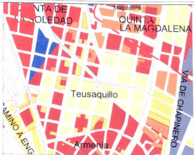
CRECIMIENTO HISTÓRICO - CRONOLOGIA